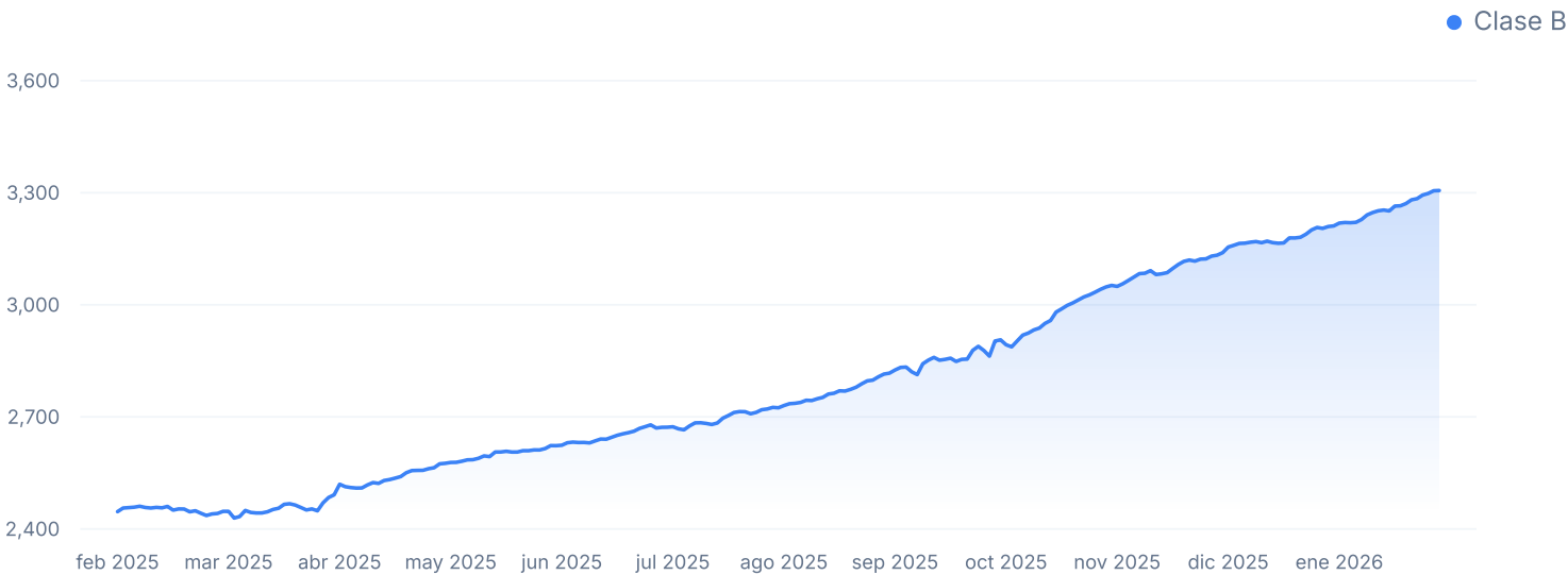
Valores de la Cuotaparte